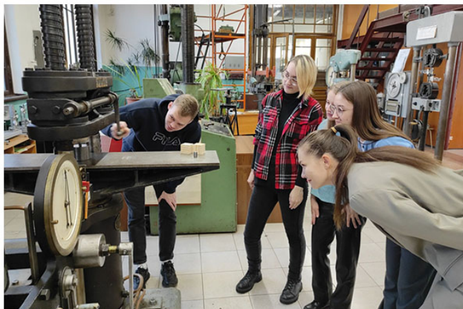
Лаб. работа № 5: «Определение модуля упругости материала (сталь)».