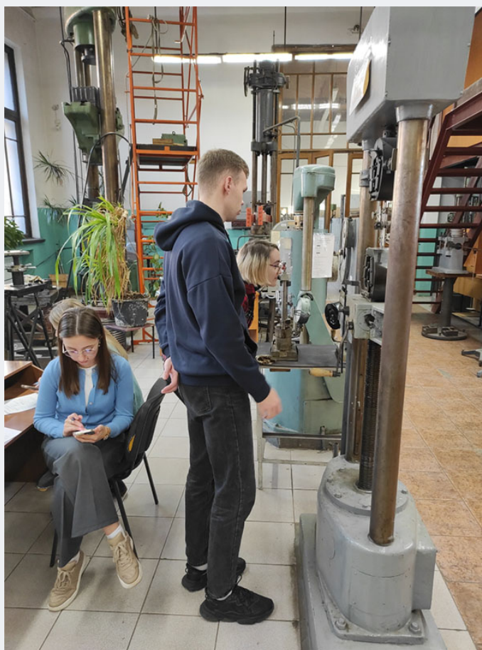
Лаб. работа № 6: «Определение коэффициента поперечной деформации материала (сталь)».