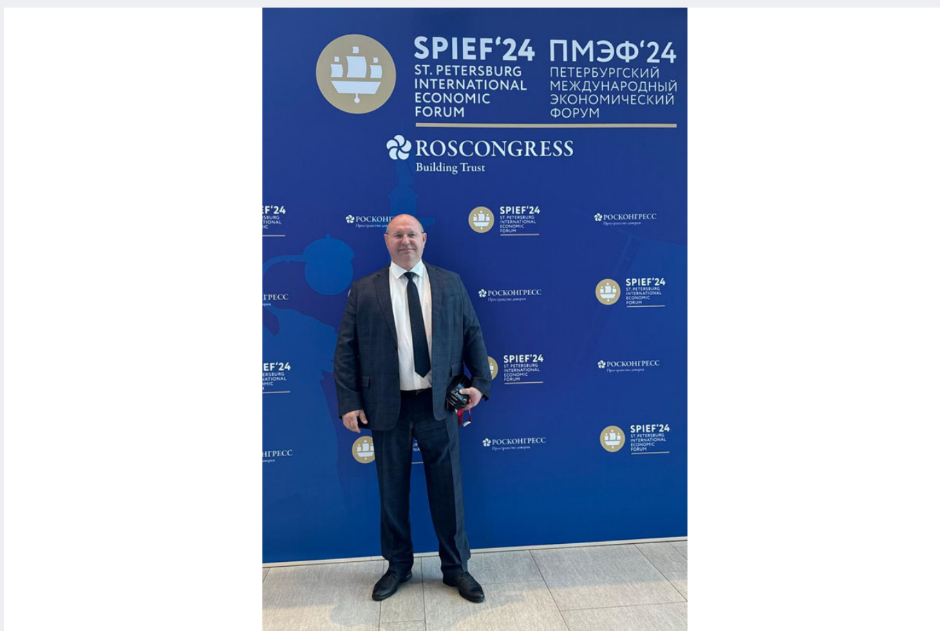
В рамках Форума были достигнуты договоренности о проведении семинаров, экскурсий, круглых столов, обмене информацией, разработке совместных программ.